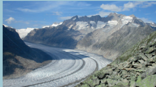
Der große Aletsch

15 Uhr · Stadt- und Bädernuseum · 4 € Tel. 038203 62026 · E-Mail: stadtmuseum@moeckelhaus.de