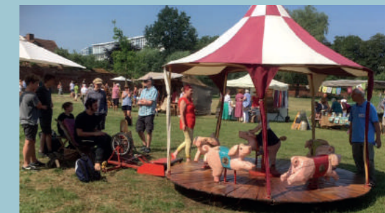
Karussell zum Klostermarkt

Verein der Freunde und Förderer des Klosters Doberan e.V. Tel. 038203 222587 · www.klosterverein-doberan.de