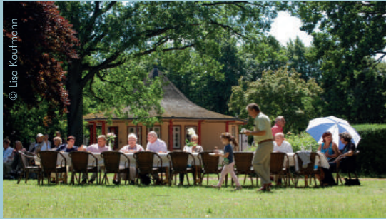
Kaffeetafel auf dem Kamp, 2017

Das diesjährige Wasserfest beginnt auf dem Kamp mit der Kaffeetafel „von weiß zu rot“. Eine lange Kaffeetafel verbindet den Weißen mit dem Roten Pavillon und lädt ein zum Sonntag-Nachmittag bei Kaffee und Kuchen. Kostüm-Publikum erinnert an die Zeit, als des Großherzogs Gäste auf dem Kamp zwischen den beiden Pavillons flanieren. 14-16 Uhr · Kamp · Eintritt frei