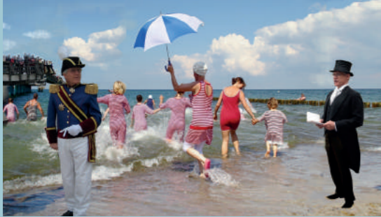
„Es ist angebadel“

Badebekleidung mitzumachen. Die historische Badegesellschaft fährt 13.35 Uhr vom Haltepunkt Stadtmitte mit dem Mollie nach Heiligendamm.