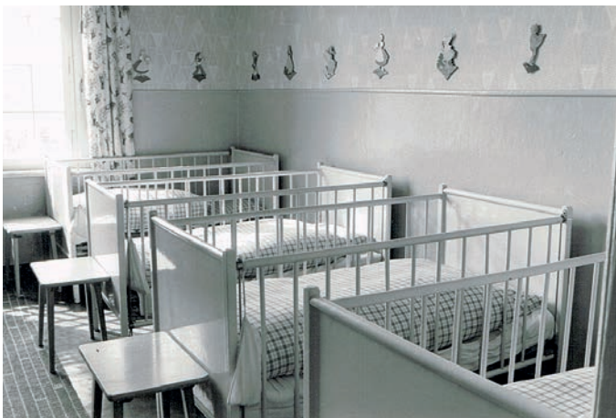
Abb. 5: ca. 1965