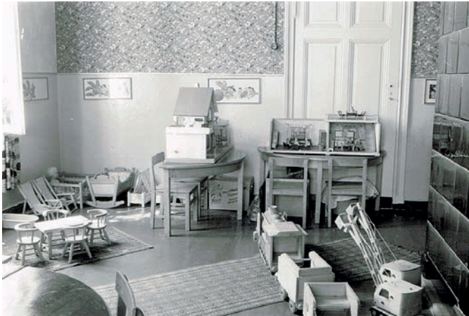
Abb. 4: ca. 1965