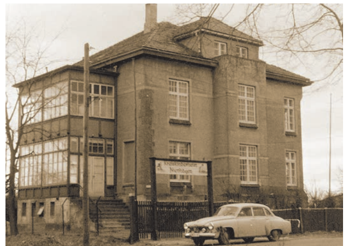
Abb 2: Außenansicht um 1950

Ab 1951 wurden in der DDR die Kinderheime nach Altersgruppen unterteilt. So wurde die Villa Buchwald zum Kreiskinderheim für Vorschulkinder. Von nun an sollten hier „anhanglose oder milieugefährdete Kleinkinder“ auf die Schule