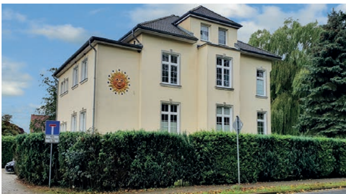
Abb. 10: Villa Buchwald 2021

Als dann ein Investor gefunden war, wurde das Grundstück erstmal geteilt. Im ehemaligen Garten, in dem Schaffner seinen Kampf gegen Quecke und Melde geführt und in dem die Kinder Gladiolen für Ehm Welk angebaut haben, wurden zwischen 1997-2000 zwei Reihenhauseinheiten (Jagdweg 1 A bis L) errichtet. Die Villa Buchwald wurde weiterveräußert und vom neuen Eigentümer bis zum Jahr 2000 saniert und zu einem Wohnhaus mit mehreren Wohneinheiten und Büroräumen (Versicherungskontor) umgebaut. Das Sonnen-Relief über dem ehemaligen Eingang des Kinderheims ist dabei erfreulicherweise erhalten geblieben.