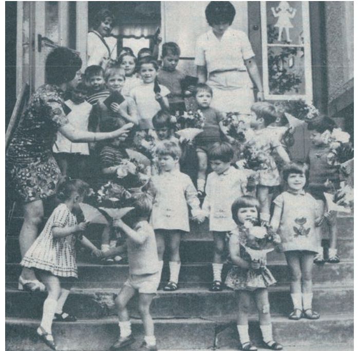
Abb. 6: In Erwartung der Paten vom MS »Nienhagen«

sicher. Banni betrieb ein intensives Networking, lange bevor dieses Wort in den deutschen Sprachgebrauch Einzug gehalten hat. In der DDR war es üblich, dass Arbeitsgruppen aus staatlichen Betrieben, die so genannten Brigaden, Patenschaften über Schulklassen und Kindergartengruppen übernahmen. Eigentlich sollten die Kinder dadurch frühzeitig einen Einblick in die „sozialistische Produktion“ erhalten. Die „Patenbrigaden“ haben ihre „Patenklassen“ häufig aber auch materiell und personell, z. B. bei Bau- und Renovierungsmaßnahmen und kleinen Reisen unterstützt. Das Kinderheim Nienhagen hat gleich mehrere solcher Patenschaften, u. a. zur Ferkelaufzucht der LPG, zum Fernmeldeamt Rostock und zur