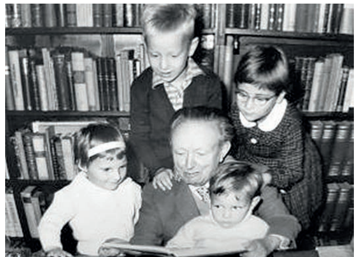
Abb. 7: Ehm Welk liest Kindern aus Nienhagen vor

Aus demselben Grund wurde auch eine ganz besondere Beziehung zu Ehm Welk (*1884, †1966), dem dritten Schriftsteller in unser Geschichte, liebevoll gepflegt. Der Autor zahlreicher Bücher (u.a. Die Heiden von Kummerow ) hatte sich 1950 in Bad Doberan niedergelassen, um hier gemeinsam mit